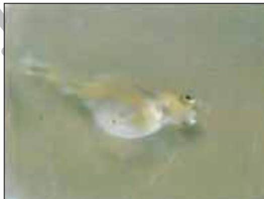
شکل ۱- لارو آنومال ماهی قزل آلا با عارضه بدشکلی سر و تورم کیسه زرده

شدند. لاروهای غیر نرمال عمدتاً دارای سر بزرگ بدنی کمانی شکل، دم کوتاه و شکم بزرگ دیده می‌شوند (شکل‌های ۱، ۲، ۳ و ۴) این گونه لاروها در ته انکوباتور و ترف خوابیده و با حرکت دورانی به دور خود می‌چرخند و اصولاً به مرحله تغذیه فعال نرسیده و به زودی تلف می‌شوند. تعدادی از لاروهای آنومال که از لحاظ شکل ظاهری سالم هستند و در مرحله تغذیه فعال که معمولاً پس از جذب ۸۰٪ کیسه زده است از جمعیت رو به رشد بچه ماهی جدا شده و تلف می‌شوند. تنها درصدی از لاروها آنومال که نقص بدنی آنها در نقاط حساس بدن قرار ندارند امکان بقا و رشد را می‌یابند. درصد و تعداد بچه ماهیان ناقص الخلقه در تلاقی سری اول (تلاقی فامیلی) و سری دوم (تلاقی غیر خویشاوندی) در جداول ۱ و ۲ ارائه شده است. در هر دو نوع تلاقی معمولاً در طی یک هفته پس از تفریح تلفات زیاد بوده ولی بعداً کم شده و تا زمانی که لاروها به طول ۲ سانتی‌متر رسیدند تلفات در حد بسیار پائین و به ندرت دیده شد. بیشترین درصد آنومالی در طی هجری کجی ستون فقرات، ضایعات سر پوش برانشی و بد شکلی جمجه سر است. درصد اینگونه ماهیان ناقص الخلقه نسبت به تفریق تا پایان جذب کیسه زرده در گروه ماهیان همخون 2 \pm 22/1 درصد و در گروه ماهیان غیر همخون 21/8 درصد بوده که اختلاف معنی داری بین درصد لاروهای