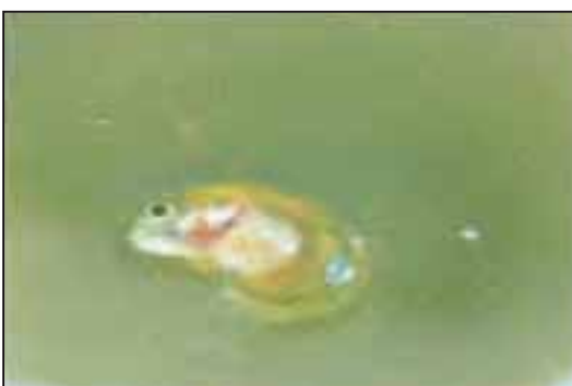
شکل ۴- لارو آنومال ماهی قزل آلا دارای سر بزرگ، بدن کمان شکل و شکل بزرگ

ناقص در دو گروه وجود نداشت ( p > 0/960 ). درصد لاروهای ناقص الخلقه در پایان جذب کیسه زرده نسبت به لاروهای باقی مانده در سه مرحله زمانی در شرایط کارگاه اختلاف معنی دار شدیدی را در هر دو گروه نشان داده ( p < 0/00 ) ولی پس از شروع تغذیه فعال تعداد این لاروها به صورت نسبتاً ثابتی باقی مانده و اختلاف معنی داری بین تعداد آنها در مراحل مختلف نمونه برداری در گروه ماهیان همخون ( p > 0/457 ) و غیر همخون ( p > 0/934 ) مشاهده نشد. علاوه بر این با سطح ۹۵ درصد اطمینان تفاوت بین میانگین تعداد بچه ماهیان هیچ یک از مراحل نمونه برداری ۱۵۰ تا ۳۰۰ روزگی در گروه همخون با گروه غیرهمخون مشاهده نگردید (به ترتیب: p > 0/775 ، p > 0/774 ، p > 0/703 ). پس از جذب کامل کیسه زرده که همراه با تغذیه خارجی است درصد تلفات کاهش می یابد. لارو تا یک ماه پس از شروع تغذیه فعال تلفات اصلی را داشته و در این مرحله تنها 4 \pm 1 درصد لاروهای ناقص زنده ماندند. بیشتر لاروهایی که در این مرحله باقی ماندند دارای کجی ستون فقرات بودند و به عبارتی لاروهایی که دارای اشکال در سر و سرپوش برانشی و یا نقاط حساس بدن بودند تا قبل از این مرحله تلفات داده و حذف شدند. در ماهیان ناقص الخلقه کوتاهی یا شکستگی دم، شایعترین آنها بوده است. فراوانی این عارضه در بین ماهیان آنومال در مجموع کل آزمایشات انجام شده ۹۲٪ بوده است (شکل ۵ و ۶). سایر عارضه‌های مشاهده شده به ترتیب فراوانی شامل بد شکلی سر ۲٪ اشکال در سرپوش برانش ۵٪ فوزکردگی ۱٪ بوده است.