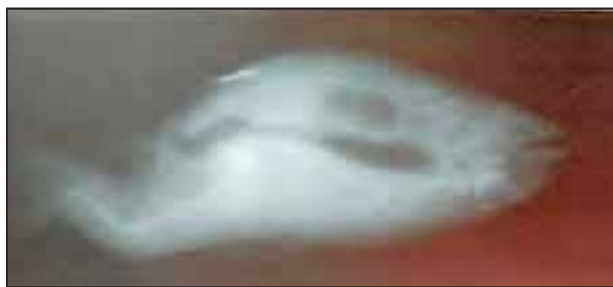
شکل ۷- نقص ستون فقرات در ناحیه پشت و دم ماهی قزل آلا (تصویر با اشعه x)

در اکثر ماهیان منشاء آنومالی‌ها بیشتر به شرایط مدیریتی و محیطی