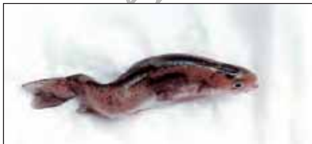
شکل ۶- خمیدگی انتهای بدن و دم در ماهی قزل آلا رنگین کمان

ماهیانی که دارای نقص ستون مهره ها بودند رشد نامتوازن داشته و علائم نقص از یک ماهگی به خوبی قابل تمایز بود. وزن آنها در این سن ۴۰۰ میلی گرم بود. میانگین وزن ماهیان سالم در این زمان ۴۶۴ میلی گرم بوده است. در بیشتر ماهیان آنومال بررسی شده، این گونه ماهیان در ناحیه دم حالت یکنواختی خود را از دست داده و در برخی موارد دم به طور کلی به صورت جدا و مستقل بوده است. باله دم نسبت به حالت طبیعی بالاتر بوده و خط جانبی مسیر نامنظمی را طی می کرد این ماهیان از ماهیان طبیعی کوتاه تر بودند. آزمایش X با اشعه (x-ray شکل ۷) نشان داد که ستون فقرات پشتی، شکمی دارای انحنایی به صورت شکل V می باشد. در حالت حاد آنومالی ستون فقرات در ناحیه انحناء با طناب عصبی جفت شده است که اصطلاحاً بنام (Xgpholor dosis) نامیده شده و رسوبات کلسیمی را نشان می دهد (شکل ۷). در این ماهیان طناب عصبی در ناحیه شکمی بوسیله فشار ماهیچه های شکمی خم گردیده است و ماهی از این جهت نیز دچار مشکل است در مطالعات انجام شده در این تحقیق، مشخص گردید که ماهی قزل آلا دارای ۶۳ مهره در ستون فقرات، که ۱۴ عدد سینه ای، ۳۱ عدد شکمی