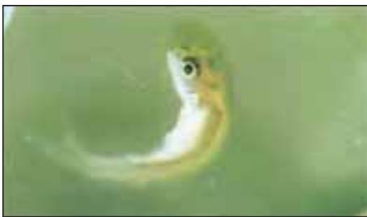
شکل ۳- لارو آنومال قزل آلا با خمیدگی ستون فقرات