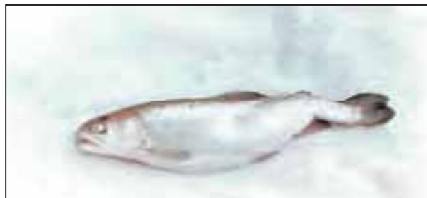
شکل ۵- شکستگی دم در ماهی رنگی قزل آلا رنگین کمان